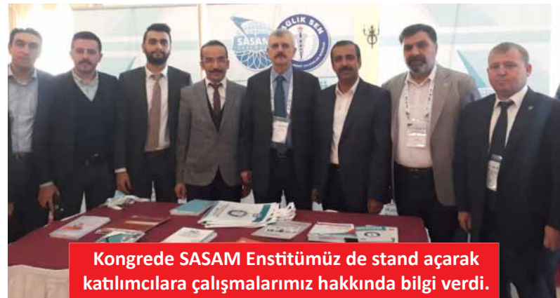
Kongrede SASAM Enstitümüz de stand açarak katılımcılara çalışmalarımız hakkında bilgi verdi.