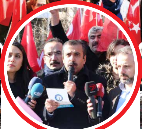
Sağlık-Sen'den TTB'ye Suç Duyurusu 4»