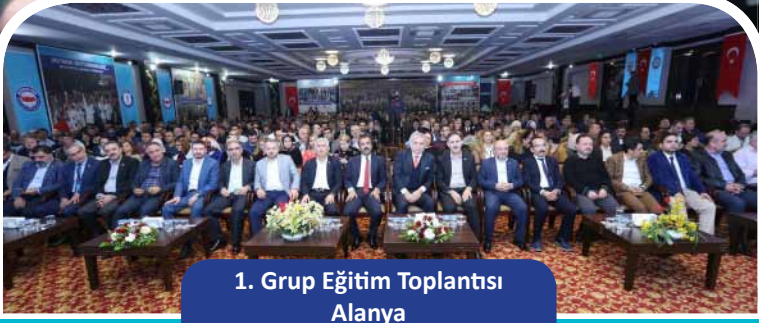
1. Grup Eğitim Toplantısı Alanya