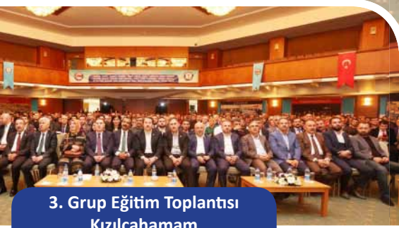
3. Grup Eğitim Toplantısı Kızılcahamam