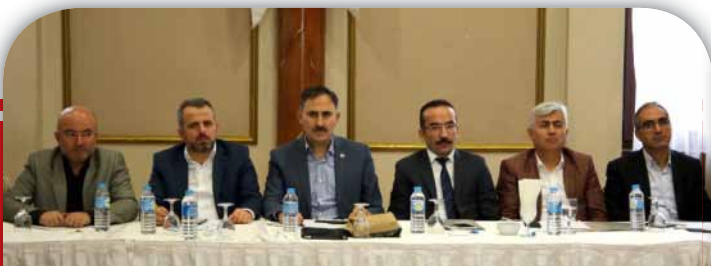
Memur-Sen Genişletilmiş Başkanlar Kurulu Toplantısında Genel Merkez Yönetim Kurulu Üyelerimiz Hazır Bulundu.

Memur-Sen üyelerinin alışverişlerinde faydalanacağı Motif Kart da toplantının gündem maddelerindendi. Kart çalışmasının sona gelindiği vurgulandı ve çok yakında hizmete gireceği belirtildi.