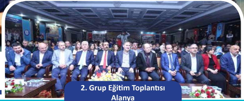
2. Grup Eğitim Toplantısı Alanya