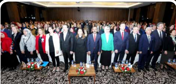
Kadınlar Komisyonumuzdan "Gelişen Türkiye, Güçlü Kadın Çalıştayı" 30»