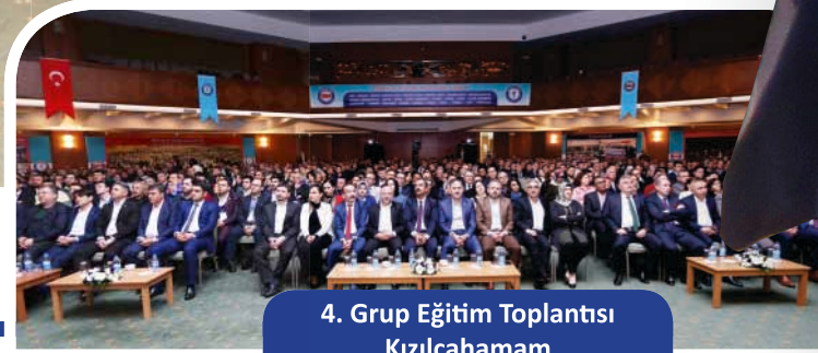
4. Grup Eğitim Toplantısı Kızılcahamam

rını kapsayacak şekilde yasalaşması gerektiğini de söyleyen Genel Başkanımız Memiş, "Sözünü Cumhurbaşkanımızın verdiği yıpranma payı, maalesef eski Türkiye'den kalma bürokratik oligarşi yüzünden gecikti. 2018'de bunun hayata geçmesini sağlayacak bir sürecin içindeyiz. Bizim isteğimiz yıpranma payının bütün sağlık çalışanlarını kapsayacak şekilde hayata geçmesidir" dedi.