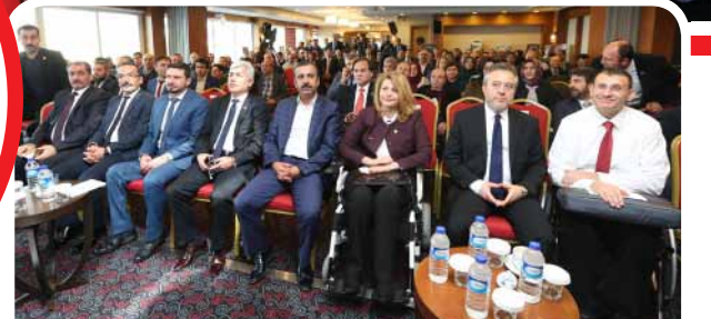
Engelliler Komisyonumuzdan "İnanıyorsan Engel Tanımazsın!" Forumu 36»