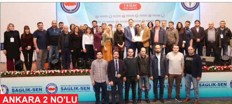
ANKARA 2 NO'LU